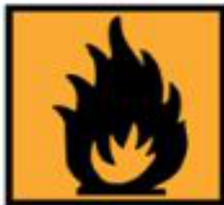
F+ - Extrêmement inflammable