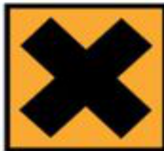
Xn - Nocif