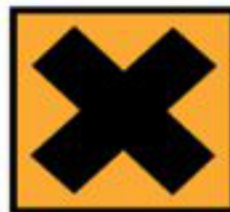
Xi - Irritant