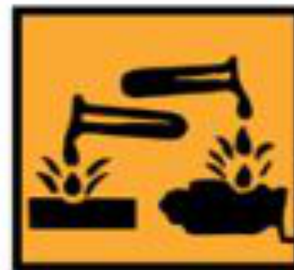
C - Corrosif