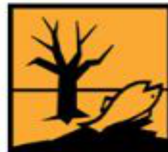
N - Dangereux pour l'environnement