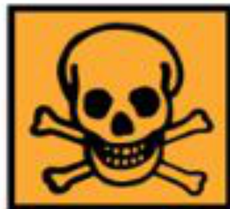
T+ - Très toxique