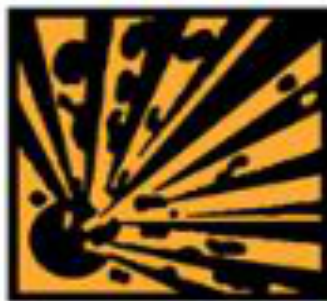
E - Explosif