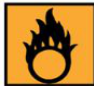
O - Comburant