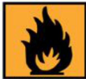
F - Facilement inflammable